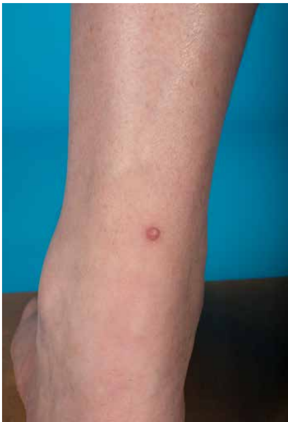
Figuur 1. Overzichtsfoto.

De afgelopen jaren hebben we het hele spectrum van de dermatoscopie, variërend van gepigmenteerde tot niet-gepigmenteerde laesies, laten passeren. De komende reeks bestaat uit een aantal uitdagende, soms verrassende casus waarbij we op basis van kliniek en dermatoscopie ruimte willen bieden voor discussie over de diagnostiek en het verder te volgen beleid.