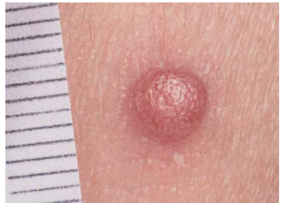
Figuur 2. Macroscopische opname.