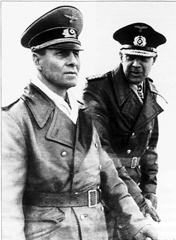
Veldmaarschalk Erwin Rommel met admiraal Friedrich Ruge in Normandië

geving over de gebeurtenissen in juli 1943 strak in de hand hield, kunnen wij ook halen uit de door hen gecontroleerde Nederlandse dagbladen, die immers hetzelfde moesten schrijven. In de NRC van 5 juli wordt de toestand van dat moment vergeleken met de situatie in juli 1918, overigens een gelijkenis waar de illegale pers in die dagen ook gretig naar verwees. Maar de NRC legt de nadruk op de verschillen. 'In 1918 moest een militaire beslissing worden geforceerd wegens de binnenlandse onrust en het grondstoffengebrek. Nu in 1943 daarentegen konden de Duitsers het zich veroorloven rustig af te wachten en werd zo de tegenstander gedwongen het initiatief te nemen'. De volgende dag maakt het Oberkommando van de Wehrmacht in de pers bekend dat de Russen in reactie op een kleine Duitse actie een grote aanval hadden ingezet. De koppen in de kranten spreken van zware gevechten bij Bjelgorod en Kursk.