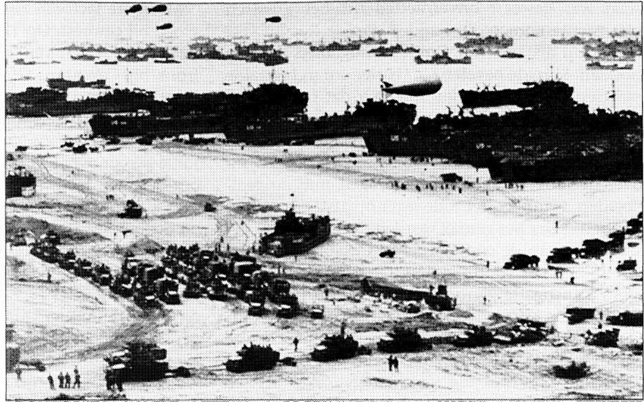
Drukte op de Normandische stranden

bijna exclusief in de laarzen van de Führer te schuiven. Deze zou op beslissende momenten tijdens en vlak na de slag dusdanige fouten hebben gemaakt, dat de commanderende veldmaarschalk Erich von Manstein en generaal Walter Model niet die successen konden boeken die anders mogelijk waren geweest. Laatstgenoemde kreeg op het congres postuum in ieder geval nog wel grote bijval, toen zijn met juwelen bezette ceremoniële maarschalksstaf langs de aanwezigen werd gedragen door een museumdirecteur in traditioneel Beiers kostuum met eerbiedig witte handschoenen aan. Een dergelijke staf bracht onlangs op een veiling in de Verenigde Staten honderdduizend dollar op, maar dat is niets vergeleken met de extatische rilling van historisch genoeg, die door veel congresgangers leek te gaan.