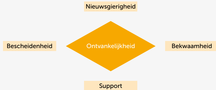
Figuur 2. De hoekpunten van ontvankelijkheid

Kan elke overheidsorganisatie uitnodigend besturen? Uitnodigend bestuur kan alleen tot stand komen als de publieke organisatie erachter ook daadwerkelijk ontvankelijk is voor initiatief van buiten. Met andere woorden: in hoeverre zij in beginsel open staat voor initiatief en daar wel—willend tegenover staat. Als zij überhaupt afwijzend of negatief tegenover initiatief van buiten staat, heeft uitnodigend besturen geen schijn van kans. Ontvankelijkheid veronderstelt dat aan een aantal voorwaarden is voldaan. Die voorwaarden zijn op te vatten als de hoekpunten die het speelveld voor uitnodigend bestuur bepalen. Naarmate er ruimhartiger is voldaan aan deze voorwaarden, is het speelveld groter.