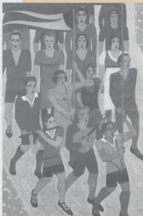
Wat zongen ze eigenlijk, deze AJC-ers? Schilderij van Johan van Hell (1928).

Tegenwoordig is het laten horen van een geluidsopname in de klas niet meer zo ingewikkeld als een aantal jaren geleden. Moest ik vroeger nog een platenspeler of een bandrecorder, een versterker en boxen aanslepen en installeren, nu neem ik mijn draagbare stereo portable radiocassetterecorder