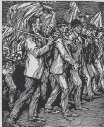
BROCHURENHANDEL DER S. D. A. P. · AMSTERDAM

De tweede les kan dan besteed worden aan de overgebleven liederen tot het jaar 1919 volgens de procedure uit de eerste les, zodat er in ieder geval overblijft om vraag 9 te maken en na te bespreken.