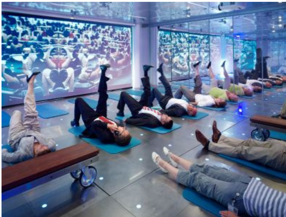
Afbeelding 1: Ambtenaren van Rijkswaterstaat in hun nieuwe ontspanningslounge 3

portemonnee en hun eigen macht. Dit populisme spreekt met name laag opgeleiden aan en in de hedendaagse politieke cultuur is de maatschappelijke onderlaag dan ook allang niet meer de onontkoombare drager van het socialistische gedachtegoed: de parasitaire boevenrol van het kapitaal is inmiddels goeddeels overgenomen door politieke, bestuurlijke en ambtelijke elites (Achterberg en Houtman, 2009; Houtman, Achterberg en Derks, 2008; Houtman en Achterberg, 2009).