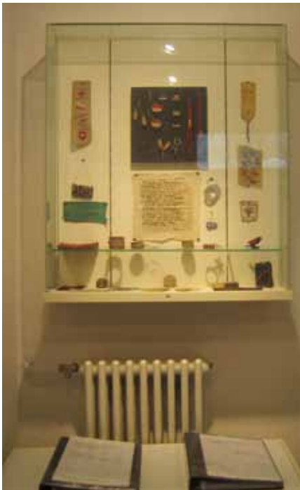
Afb. 8 Vitrine met door gevangenen vervaardigde voorwerpen in de 'Nederlandse cel'; een ruimte in het voormalige gevangenisgebouw in Ravensbrück.