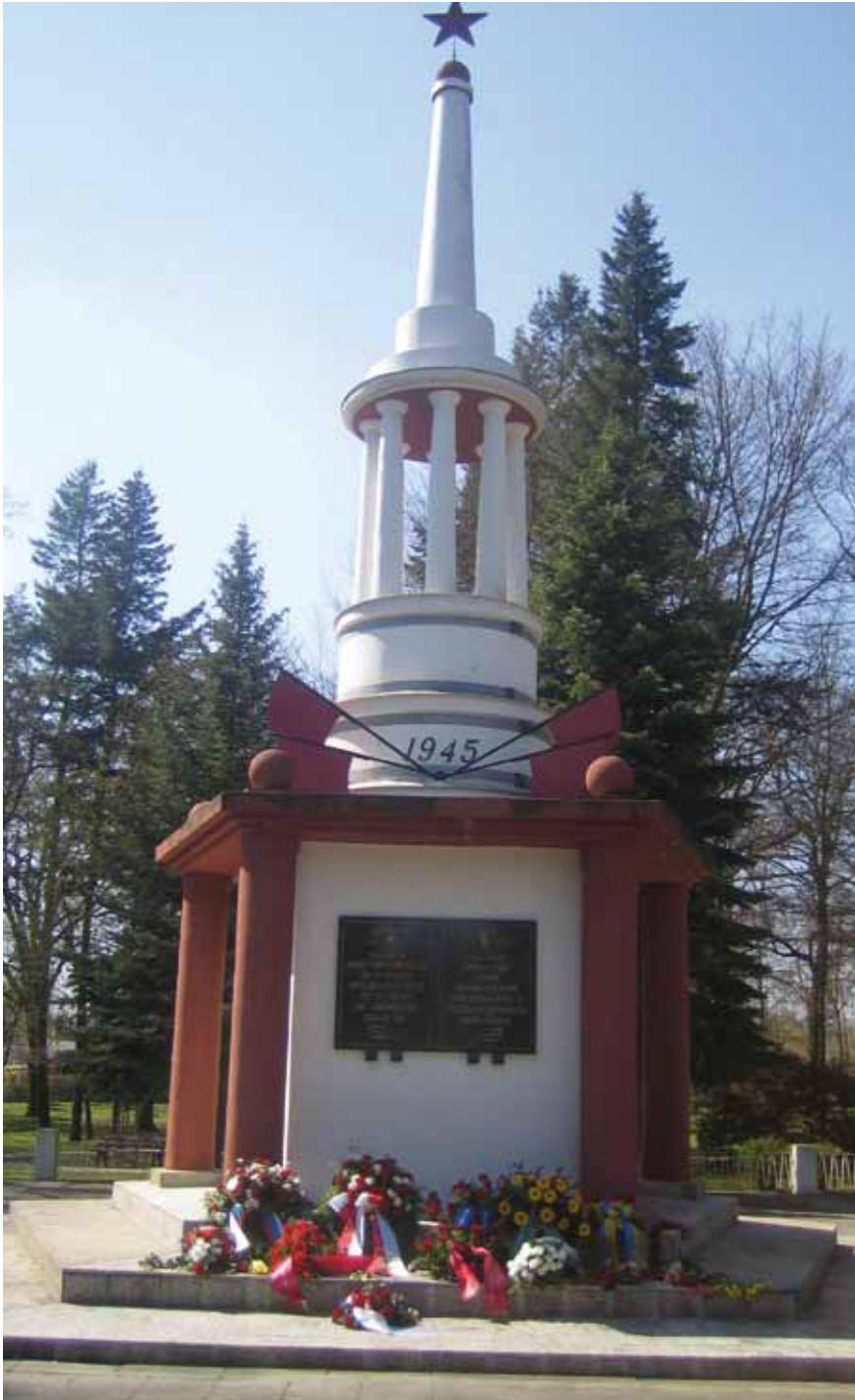
Afb. 21 Sovjet-monument in Fürstenberg bij Ravensbrück, waar oud-gevangenen in 2005 voor het eerst weer een herdenking hielden.