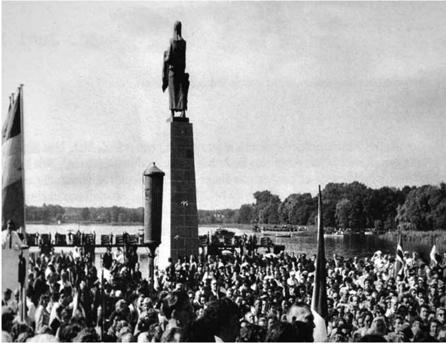
Afb. 11 Inwijding nationaal herinneringscentrum Ravensbrück in de DDR, 12 september 1959 met het monument 'Dragende'.