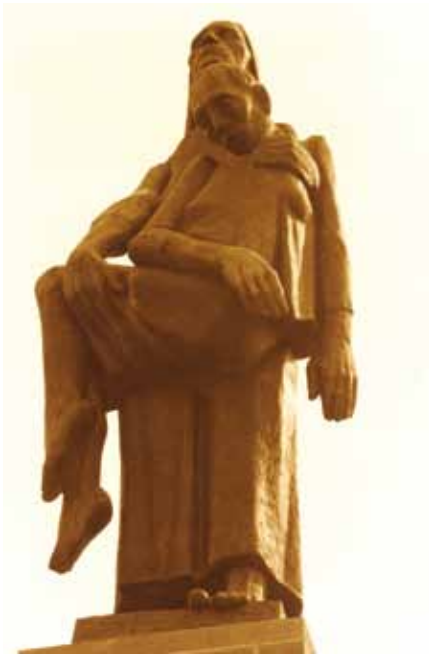
Afb. 12 Detail monument Dragende. Ontwerper: Will Lammert.