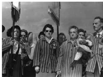
Afb. 13 Oud-gevangenen in gestreepte kampkleding tijdens de onthulling van het herinneringscentrum.