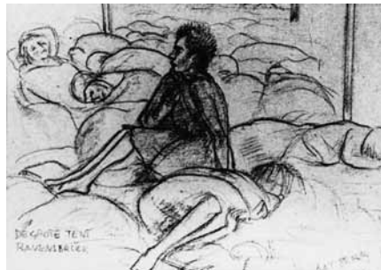
Afb. 9 Tekening gemaakt in Ravensbrück door de Nederlandse tekenares Aat Breur Hibma. In de Nederlandse cel ligt een map ter inzage met tekeningen van Nederlandse oud-gevangenen.