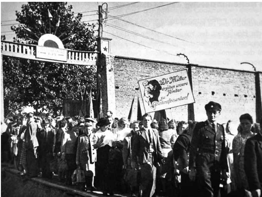
Afb. 6 Internationale herdenkingsmanifestatie in Ravensbrück, september 1949. De tekst op het bord luidt: 'Wij moeders voeden onze kinderen op tot "vredesvrienden".'