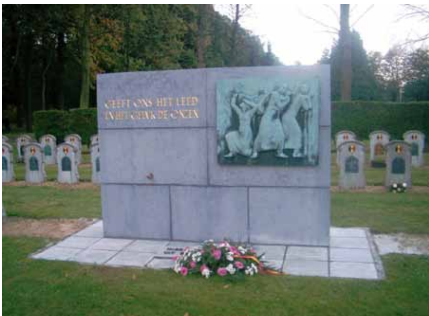
Afb. 4 Voorzijde Ravensbrück-monument op Begraafplaats Park Schoonselhof te Antwerpen, België, vermoedelijk uit 1948. De tekst luidt: 'Geef ons het leed en het geluk de onzen'.