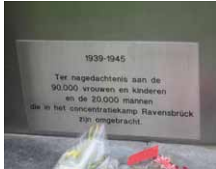
Afb. 24 Detail gedenkplaat.