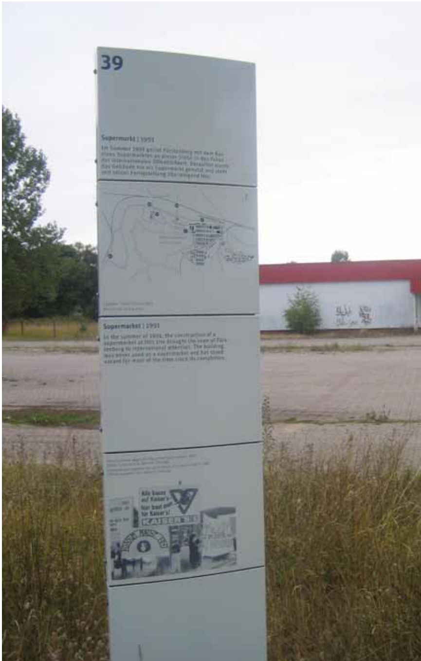
Afb. 19 Informatiebord met op de achtergrond het gebouw aan de toegangsweg naar Ravensbrück waar zich in 1991 een supermarkt zou vestigen. Na internationaal protest van onder meer oud-gevangenen bleef het gebouw leeg. Sinds 2007 is het een onderdeel van de 'herinneringsplaatsen' die aan de hand van een audio-tour te bezichtigen zijn.