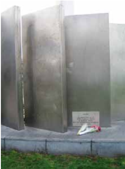
Afb. 23 Achterzijde Ravensbrück-monument te Amsterdam met onderaan de gedenkplaat voor de mannelijke gevangenen, onthuld in april 2005.