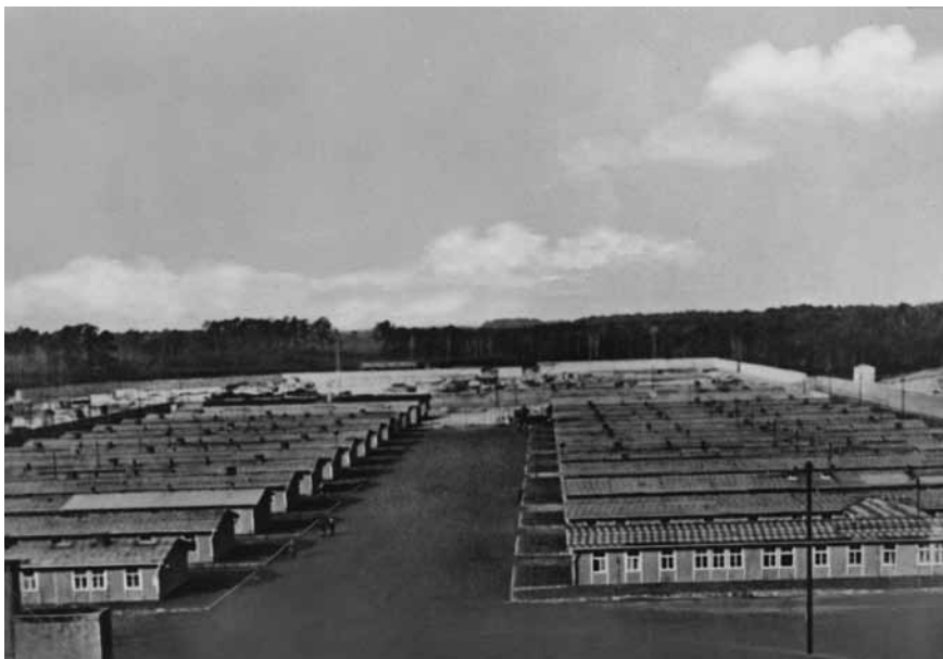
Afb. 3 Uitzicht over het kamp. Datum onbekend.