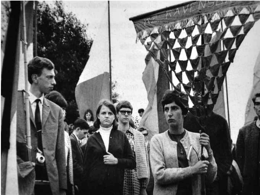
Afb. 26 Manifestatie voor kinderen van Ravensbrück-overlevenden uit verschillende landen in het voormalige kamp, in juli 1967 georganiseerd door het IRC. Hier de Oostenrijkse delegatie met het Ravensbrück-vaandel, bestaande uit meerdere kleine rode driehoeken (het symbool van de politieke gevangenen).