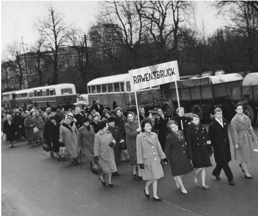
Afb. 1 Demonstratie van Poolse oud-gevangenen van Ravensbrück in Warschau, 1962. Vooraan loopt een mannelijke Ravensbrück-overlevende, herkenbaar aan de driehoek op zijn kleding.