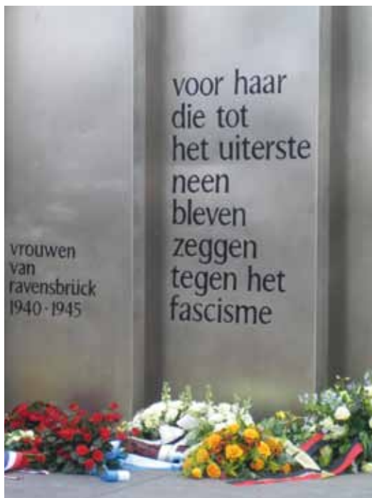
Afb. 18 Detail Ravensbrück-monument te Amsterdam.