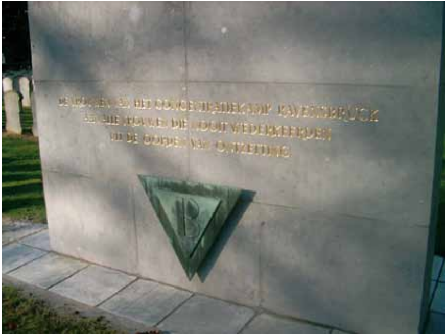
Afb. 5 Achterzijde. 'De vrouwen van het concentratiekamp Ravensbrück. Aan alle vrouwen die nooit weerkeerden uit de oorden van ontzetting.'