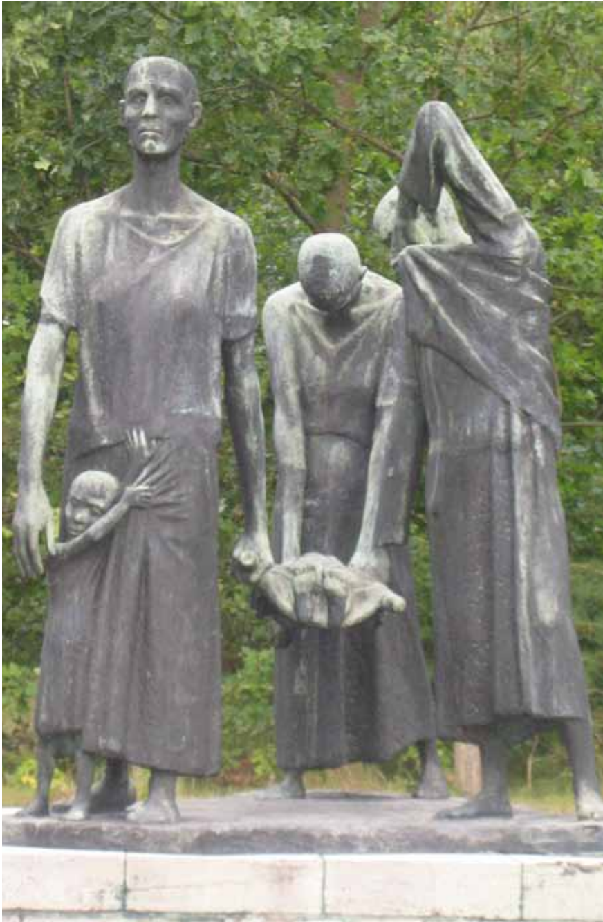
Afb. 10 Monument 'Moedergroep' in herinneringscentrum Ravensbrück (1965). Ontwerper: Fritz Cremer.