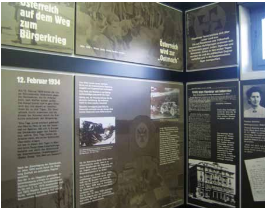
Afb. 15 Wandborden uit de Oostenrijkse cel.