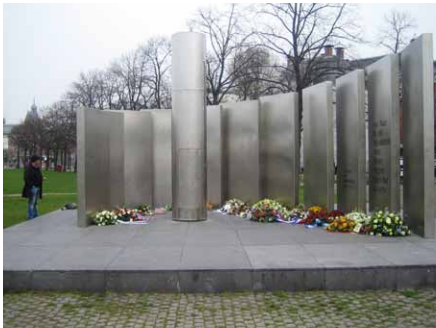
Afb. 17 Ravensbrück-monument op het Museumplein in Amsterdam (1975). Ontwerpers: Guido Eckhardt, Frank Nix en Joost van Santen.