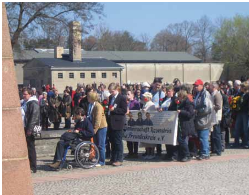
Afb. 20 Honderden mensen leggen bloemen of kransen bij het monument in Ravensbrück tijdens de herdenking van de bevrijding, april 2010. Hier leden van het Duitse Ravensbrück-comité achter hun vlag.