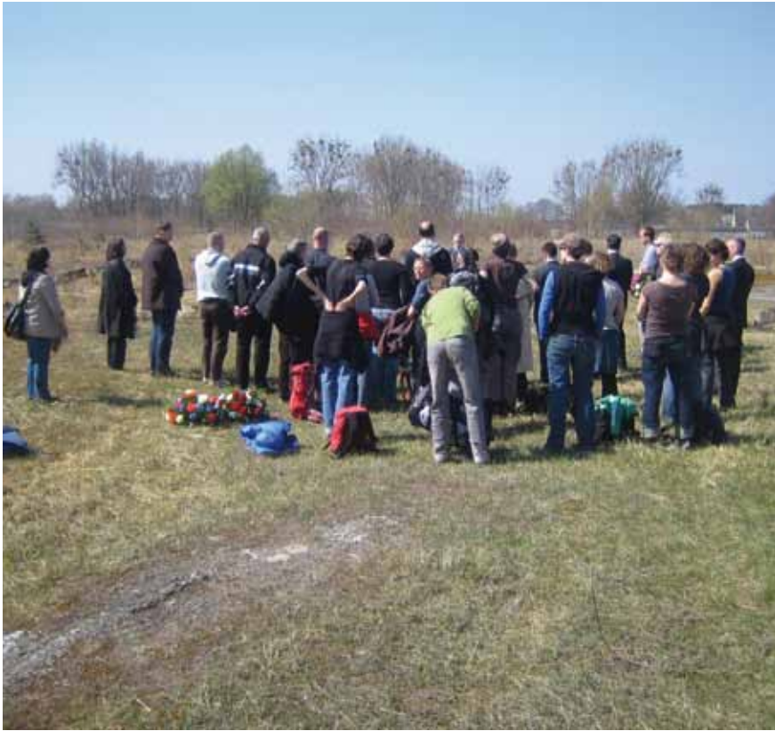
Afb. 22 Tijdens de herdenking van de bevrijding van Ravensbrück in april 2010 hield een klein groepje belangstellenden een herdenking op het terrein van het voormalige mannenkamp. Anders dan van het vrouwenkamp zijn van het mannenkamp alleen nog fundamente te zien.