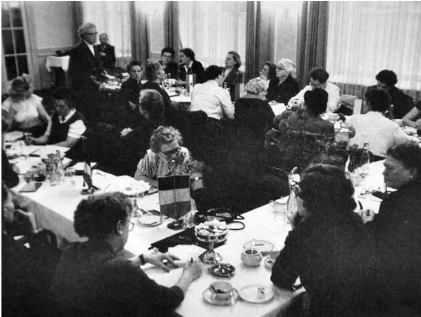
Afb. 7 Het Internationale Ravensbrück Comité bijeen in Oost-Berlijn, mei 1956.