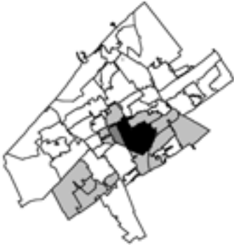
Figuur 3a: Spreiding legale Turken over Den Haag (% totale bevolking)