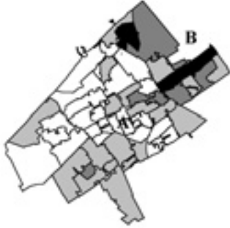
Figuur 5a: Spreiding legale Oost-Europeanen over Den Haag