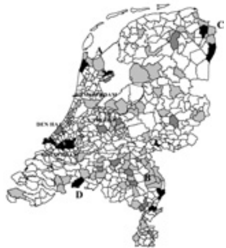
Figuur 1b: De spreiding van de illegale bevolking over Nederland (relatieve concentratie)