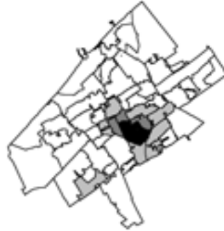
Figuur 3b: Spreiding van illegale Turken over Den Haag (relatieve concentratie)