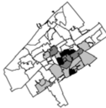
Figuur 4b: Spreiding van illegale Marokkanen over Den Haag