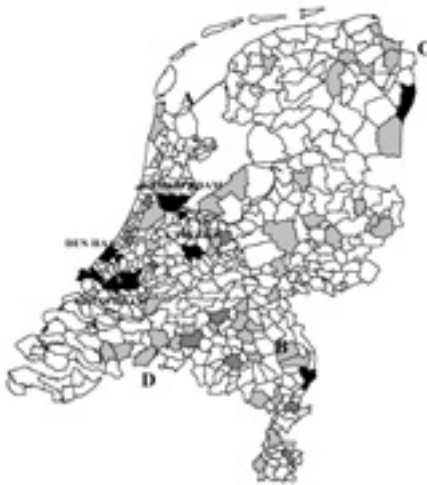
Figuur 1a: De spreiding van de illegale bevolking over Nederland (absolute concentratie)