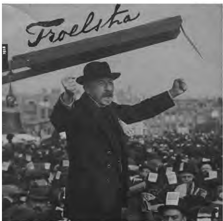
De Werdtoering was op 13 november 's ochtands gelidigd met een wapenstichting, maar in Nederland liep de spandoek met het voorvoet op. 'Awards dwigle naar-beder Peter Jelles Troelstra in Rotterdam met revolutie en de volgende dag herhaalde hij zijn dringende in de Tweede Kamer. Het was een politieke vergissing van de partijleiders, maar het glijdende sociale hervormingen wamen arwat.