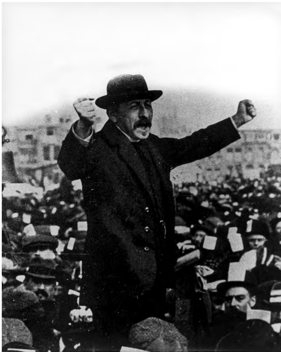
AfB. 4. Pieter Jelles Troelstra houdt een toespraak op de tweede Rode Dinsdag van 17 september 1912 in Den Haag.

De uitdaging voor historici is vooral de betekenisverandering van dit soort foto's te verklaren. Hoe kan het dat een foto van een demonstratie voor algemeen kiesrecht uit 1912 gebruikt wordt om een revolutiepoging uit 1917 te illustreren? Voor het onderhavige artikel laat dit voorbeeld vooral zien wat voor resultaten uit een data-