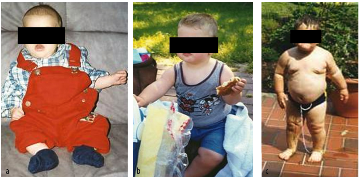
FIGUUR 2 Foto's van een jongen met een homozygote mutatie van het MC4R -gen, waardoor hij al op jonge leeftijd obese werd: (a) 3 maanden oud, (b) 1 jaar oud en (c) 2 jaar oud.

Er zijn verschillende studies uitgevoerd naar de frequentie van MC4R -mutaties bij mensen met obesitas, waarbij een dragerschapprevalentie werd gevonden van 0,5-6% bij obese personen. 14-18 De prevalentie is afhankelijk van de groep die onderzocht wordt. De eerder genoemde Frans-Zwitserse studie vond een heterozygote MC4R -mutatie bij 1,8% van 526 obese kinderen en bij 1,6% van 1731 obese volwassenen. 16 Wij screenen 291 Nederlandse patiënten van een polikliniek voor kinderen met overgewicht op mutaties in MC4R -gen. Bij 6 (2,1%) van deze kinderen werd een heterozygote genmutatie gevonden die resulteerde in functieverlies van de MC4 -receptor. 18 Dit percentage komt overeen met de cijfers uit de Frans-Zwitserse studie. De prevalentie van patiënten met homozygote of samengesteld heterozygote mutaties is onbekend; dit zijn zeldzame aandoeningen.