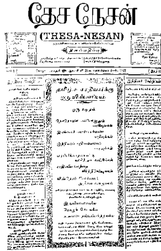
நடேசய்யர் அவர்களால் 1920 - 1923 வரை வெளியிடப்பட்ட 'தேவநேசன்' பத்திரிகை

நகரத் தொழிலாளர் சங்கத்திலும் தீவிர செயற்பாடுள்ள ஒருவராக நடேசய்யர் இருந்தார். 1926 க்கும் 1928 க்கும் இடைப்பட்ட காலத்தில் சிங்களவரான ஏ.ஈ குணசிங்க என்ற தொழிற்சங்கத் தலைவருடன் நெருங்கிய தொடர்பு கொண்டு பணியாற்றினார். 1920 களில் தோட்டத் தொழிலாளர்களின் பரிதாபநிலை கண்டு அனுதாபம் காட்டிய தொழிற்சங்கத் தலைவர்களில் ஏ.ஈ. குணசிங்கவும் ஒருவராவார். நடேசய்யரும் குணசிங்கவும் 'Forward' என்னும் பத்திரிகையின் இணை ஆசிரியர்களாக இருந்தனர். இந்த ஆங்கிலப் பத்திரிகை இலங்கைக்குப் பூரண சுதந்திரம் வேண்டும் என்று குரல் கொடுத்தது. இங்கையின் அரசியல் தலைவர்களை இப்பத்திரிகை தாக்கி எழுதியதோடு முசோலினியையும் கண்டனம் செய்து எழுதியது 1 . 1927 ஆம் ஆண்டின் துறைமுகத் தொழிலாளர் வேலை நிறுத்தத்தின் போது நடேசய்யர் ஏ.ஈ. குணசிங்கவிற்கு உதவினார். துறைமுகத்தில் வேலை செய்த இந்தியத் தொழிலாளர்களை வேலை நிறுத்தத்தில் சேர்ந்துகொள்ளும்படி கேட்டுக்கொண்டார். இருவரும் சேர்ந்து வர்த்தகர்களிடம் வேலை நிறுத்தத்திற்காக நிதி திரட்டினர். நகரத் தொழிலாளர் வர்க்கத்தின் தொழிற்சங்க இயக்கத்தில் நடேச ஐயர் பெற்றுக் கொண்ட அனுபவம்,