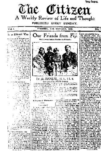
1922 ஆம் ஆண்டு நடேசய்யரால் வெளியிடப்பட்ட 'சிட்டிசன்' ஆங்கிலப் பத்திரிகை

நகரத் தொழிலாளர் சங்கத்திலும் தீவிர செயற்பாடுள்ள ஒருவராக நடேசய்யர் இருந்தார். 1926 க்கும் 1928 க்கும் இடைப்பட்ட காலத்தில் சிங்களவரான ஏ.ஈ குணசிங்க என்ற தொழிற்சங்கத் தலைவருடன் நெருங்கிய தொடர்பு கொண்டு பணியாற்றினார். 1920 களில் தோட்டத் தொழிலாளர்களின் பரிதாபநிலை கண்டு அனுதாபம் காட்டிய தொழிற்சங்கத் தலைவர்களில் ஏ.ஈ. குணசிங்கவும் ஒருவராவார். நடேசய்யரும் குணசிங்கவும் 'Forward' என்னும் பத்திரிகையின் இணை ஆசிரியர்களாக இருந்தனர். இந்த ஆங்கிலப் பத்திரிகை இலங்கைக்குப் பூரண சுதந்திரம் வேண்டும் என்று குரல் கொடுத்தது. இங்கையின் அரசியல் தலைவர்களை இப்பத்திரிகை தாக்கி எழுதியதோடு முசோலினியையும் கண்டனம் செய்து எழுதியது 1 . 1927 ஆம் ஆண்டின் துறைமுகத் தொழிலாளர் வேலை நிறுத்தத்தின் போது நடேசய்யர் ஏ.ஈ. குணசிங்கவிற்கு உதவினார். துறைமுகத்தில் வேலை செய்த இந்தியத் தொழிலாளர்களை வேலை நிறுத்தத்தில் சேர்ந்துகொள்ளும்படி கேட்டுக்கொண்டார். இருவரும் சேர்ந்து வர்த்தகர்களிடம் வேலை நிறுத்தத்திற்காக நிதி திரட்டினர். நகரத் தொழிலாளர் வர்க்கத்தின் தொழிற்சங்க இயக்கத்தில் நடேச ஐயர் பெற்றுக் கொண்ட அனுபவம்,